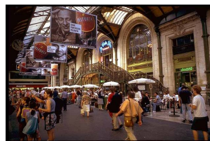
Restaurant de la gare de Lyon